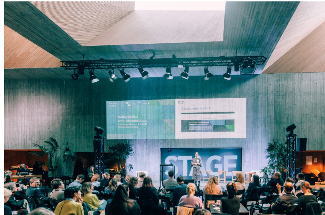
Kuva: Circular Design -valmennusohjelman kaikille avoin aloitustapahtuma 4.10.2022