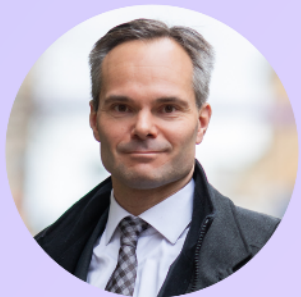
Kai Mykkänen ympäristö- ja ilmastoministeri

”Kiertotalouden green dealissa valtio, yritykset, järjestöt, kaupungit ja maakunnat kokoontuvat yhteen ratkomaan kiertotalousmarkkinoiden pullonkauloja. Se tarjoaa keinoja myös ilmastopolitiikan puuttuvan palan löytämiseen, sillä jopa 80 % teollisuuden päästövähennysmahdollisuuksista liittyy kiertotalouteen. Tämä Suomen malli ratkoa laajalla yhteistyöllä, tieteeseen nojaten kestävyysmurroksen esteitä on EU:ssa ja maailmalla hieno tarina kerrottavaksi.”