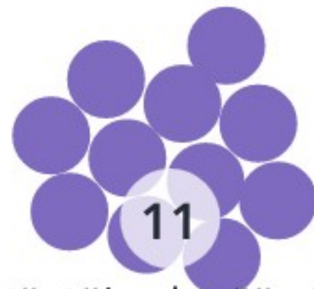
Parhaiden käytäntöjen kerääminen ja viestintä